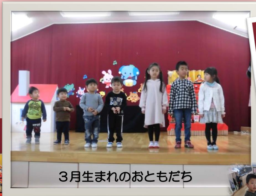
3月生まれのおともだち